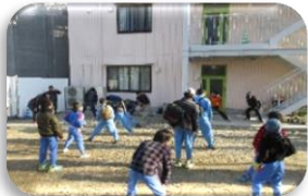
体操をして出発だ!

12 月 6 日(水曜日)に「ウォークラリー」を行いました。毎年恒例の行事で楽しみにしている園生が多く、園生がグループごとに分かれてクイズをしながら巡るものです。