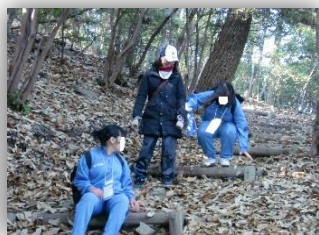
遍路道は落ち葉が沢山