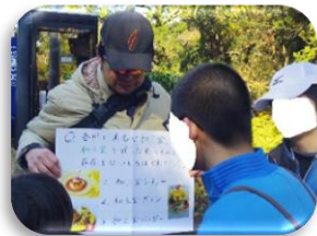
ご当地クイズ難しい

園生達はグループの親睦を図りながら五色台周辺の景色を楽しみながら歩きました。歩いている途中でお遍路さんに会う事があり「こんにちは。頑張ってください。」と大きな声で元気よくあいさつが出来ていました。